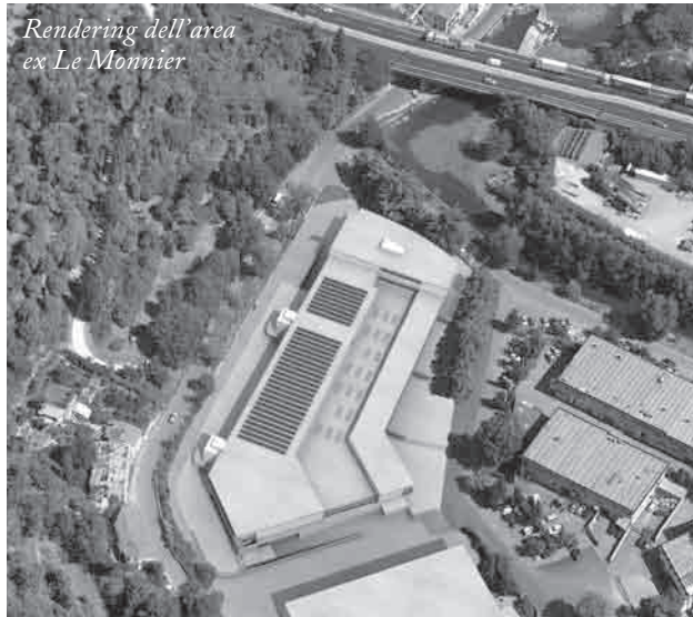
Rendering dell'area ex Le Monnier

Oratorio Santa Caterina, tutti gli eventi