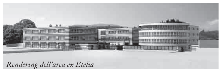
Rendering dell'area ex Etelia

Ponte a Ema - Campigliano è un centro importante. Lo è per la sua natura di collegamento fra Bagno a Ripoli (e Antella e Grassina), da un lato, e Firenze, dall'altro, ovvero i due Comuni nei quali è diviso da un punto di vista amministrativo. Ma lo è anche per se stesso, per la quantità e la qualità degli insediamenti civili, socio sanitari, ricettivi e produttivi che contiene. Il tutto in un'area significativa anche per la viabilità: accesso al Chianti, uscita dell'Autostrada del Sole, svincolo di Ponte a Niccheri, collegamento con il ponte di Varlungo e, in un futuro non lontano, la Terza Corsia dell'A1 e la Variante del Chianti. A Ponte a Ema - Campigliano, all'inizio del nostro primo mandato, c'erano tre situazioni economicamente ed urbanisticamente rilevanti da risolvere, tutte nel nostro territorio: ex-Etelia, ex-Vivauto e successivamente ex-Le Monnier. Lo stiamo facendo con questi obiettivi: valorizzare e migliorare al massimo le tre aree e i relativi immobili, riqualificare l'am- (segue a pag. 3)