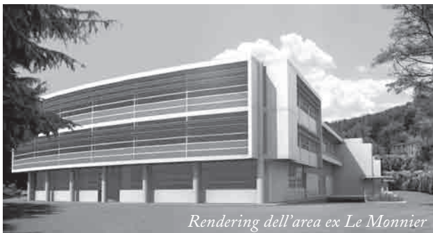
Rendering dell'area ex Le Monnier

Quando siamo partiti, nel 2004, avevamo davanti tre piccoli grandi puzzle mal combinati fra loro: oggi stiamo gettando le basi perché ogni singola tessera vada positivamente al proprio posto, a creare un disegno comune di valorizzazione e qualità della vita per Ponte a Ema - Campigliano. Certo, il lavoro è stato lungo, come non breve sarà il tempo che ci vorrà per arrivare al completamento, ma quella che abbiamo definito il "tris" per Ponte a Ema - Campigliano crediamo rappresenti un'operazione utile a tutta la nostra Comunità.