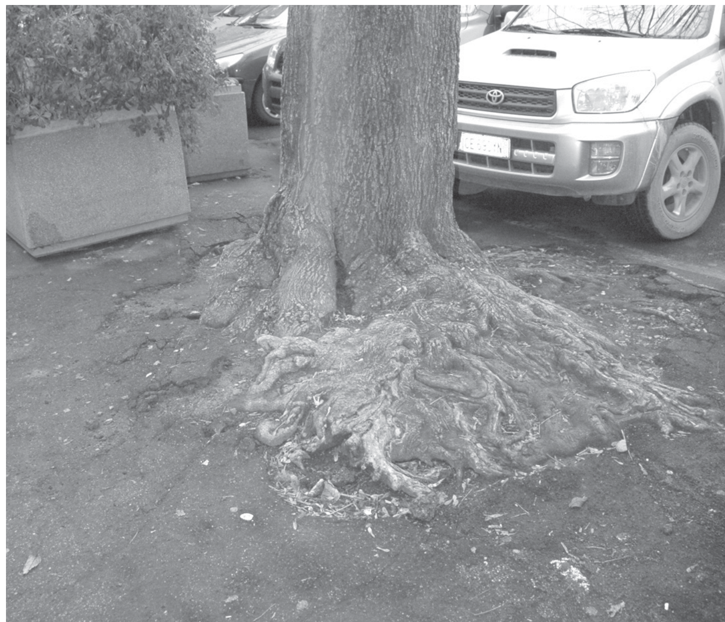
Le alberature oggi: particolare dell'apparato radicale