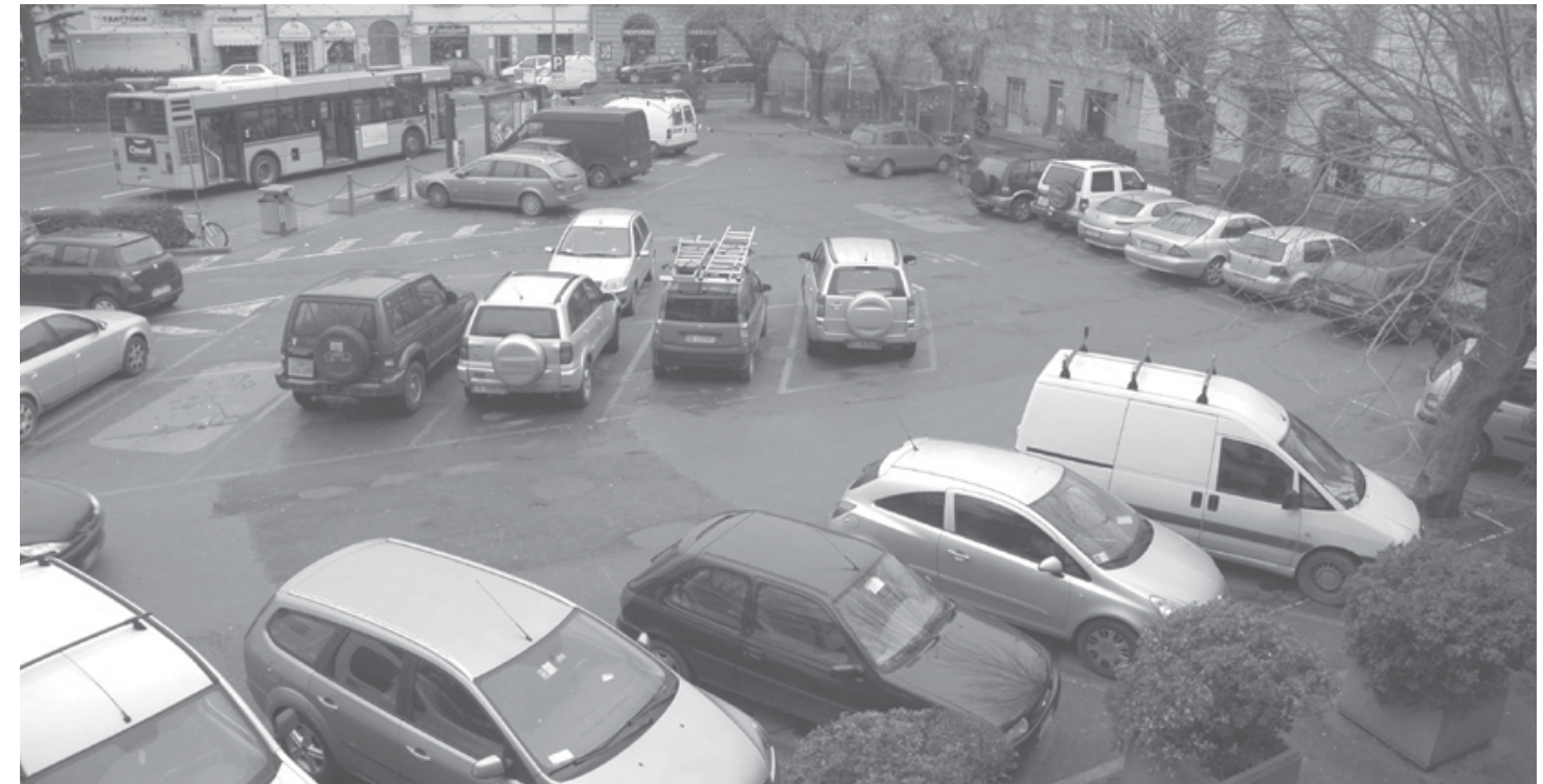
Piazza Umberto I° dall'alto

Lunedì 21 gennaio 2008: questa la data dell'inizio del I lotto dei lavori che trasformeranno il cuore di Grassina, la storica Piazza Umberto I. Rinviato al nuovo anno per motivi tecnici e per garantire la normale attività commerciale nel periodo natalizio, l'intervento mira a ridonare a Piazza Umberto I quella centralità sociale,